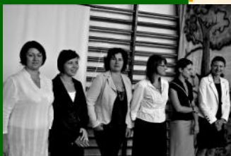
Powitanie nowych nauczycieli 1 września