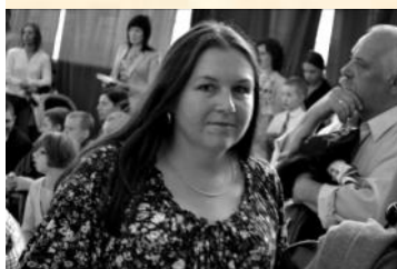
Gabinet Pani Wicedyrektor znajduje się teraz na 2. piętrze