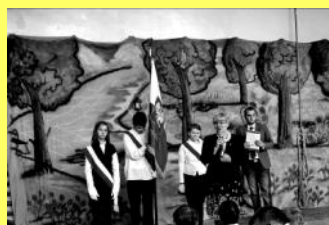
Pani Dyrektor przywitała Nas wszystkich na początek roku szkolnego

to wróciliśmy do szkoły z ogromną chęcią.